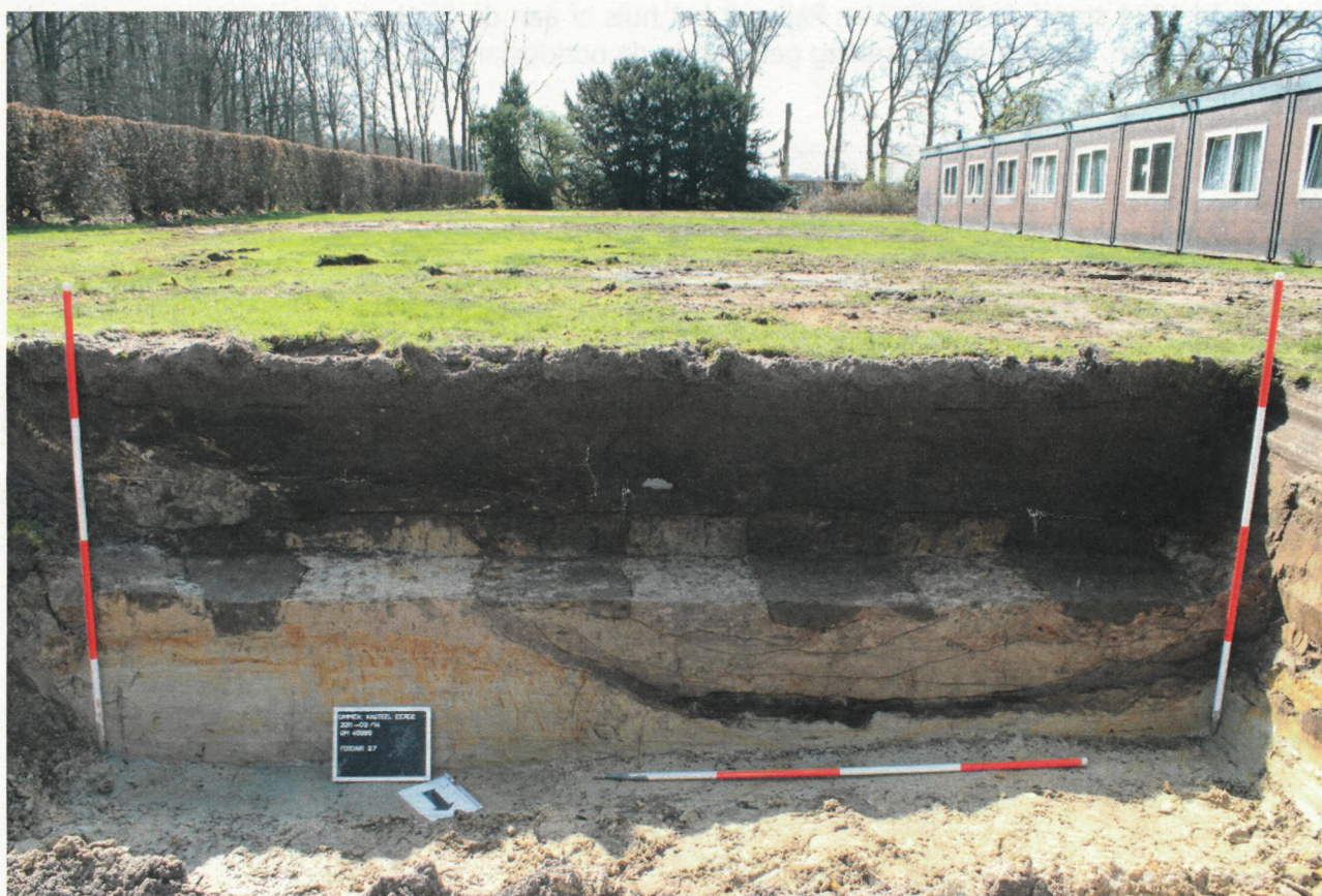
Voor archeologen zijn de moestuinbedden duidelijk herkenbaar in de ondergrond.

Het archeologisch onderzoek heeft belangrijke informatie opgeleverd over het verleden van kasteel Eerde. Doordat er geen historische bronnen en kaartmateriaal ouder dan de 18e eeuw zijn, is het alleen door archeologisch onderzoek mogelijk om de oudste geschiedenis van kasteel Eerde te onderzoeken.